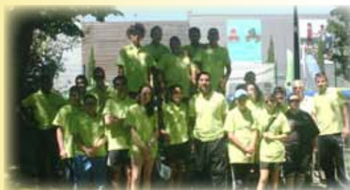
Journée des Jeunes Arbitres et Officiels Edition 2012

Toutes les photos sur notre site www.crosprovencealpes.com