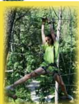
Journée des Jeunes Arbitres et Officiels Edition 2012

La 7 ème édition de la journée des jeunes arbitres et officiels, organisée par le CROS Provence-Alpes en partenariat avec les 4 CDOS, le samedi 9 juin dernier à Oxyrane Village à Bouc Bel Air, s'est déroulée une fois de plus dans d'excellentes conditions.