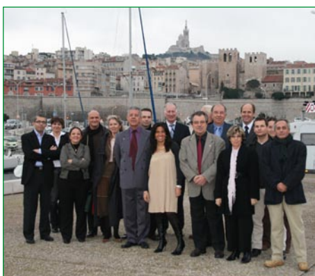
Le jury sous la haute bienveillance de la "Bonne Mère"

Plus de 200 dossiers de candidatures issus d'une quarantaine de disciplines différentes étaient sur la ligne de départ. La tâche du jury n'était pas simple et il a été procédé, pour chacune des 12 catégories, à 3 tours de vote afin de déterminer la hiérarchie entre les nominés. La proclamation des résultats se déroulera le 1er Février au Dôme de Marseille. Cette soirée officielle est devenue un des moments forts de la vie sportive de Provence Alpes Côte d'Azur.