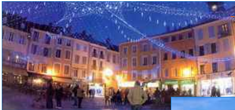
→ Une ville. Gap