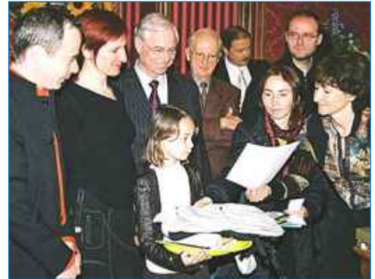
Remise des prix le 14 février à Gap ↘