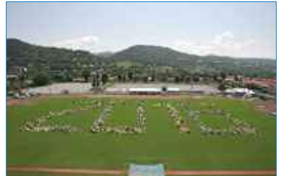
Un 2018 humain

dans cet esprit de concertation pour l'union que les présidents de l'association organisent de nombreuses réunions démocratiques, invitant l'ensemble des forces vives à s'exprimer voire même à formuler un cahier des charges. Pour l'heure, plusieurs groupements écologiques ont rejoint l'association sous certaines conditions. Elles seront respectées. C'est l'unanimité confirmée par un sondage IPSOS ( mai 2007) : 80% des habitants sont très favorables ou prêts à soutenir la candidature