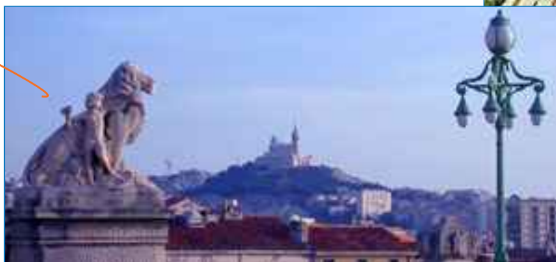
← Une région. PACA