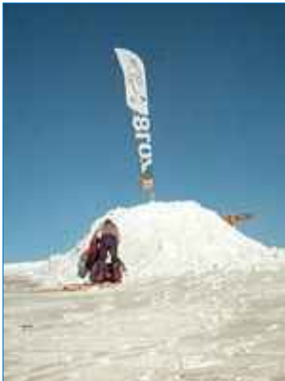
Le drapeau de Gap 2018 flotte sur la falaise de Ceüse

Gap 2018 ne souhaite pas inventer mais simplement retrouver l'esprit originel des Olympiades. Retrouver cet esprit où les hommes de toutes les couleurs, de toutes les religions, de toutes les idéologies enterreraient la hache de guerre