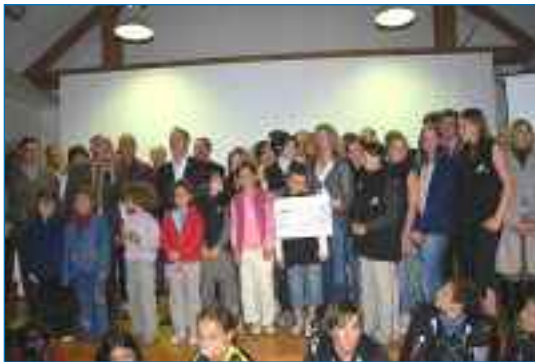
Le 4 Mai 2007 à Gap Charance ↘