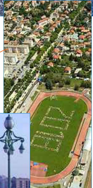
← Une population, mobilisée