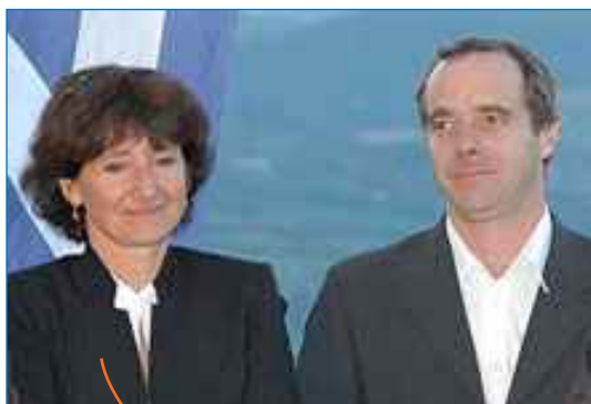
Une femme et un homme Elle du 04. lui du 05 Elle championne. lui chef d'entreprise Elle à fond. lui à fond aussi ...

Une présidence partagée. complète et complice ↗